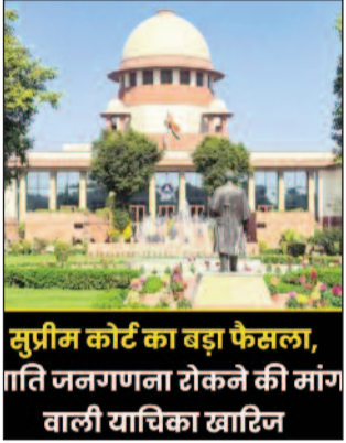
सुप्रीम कोर्ट का बड़ा फैसला, जाति जनगणना रोकने की मांग वाली याचिका खारिज